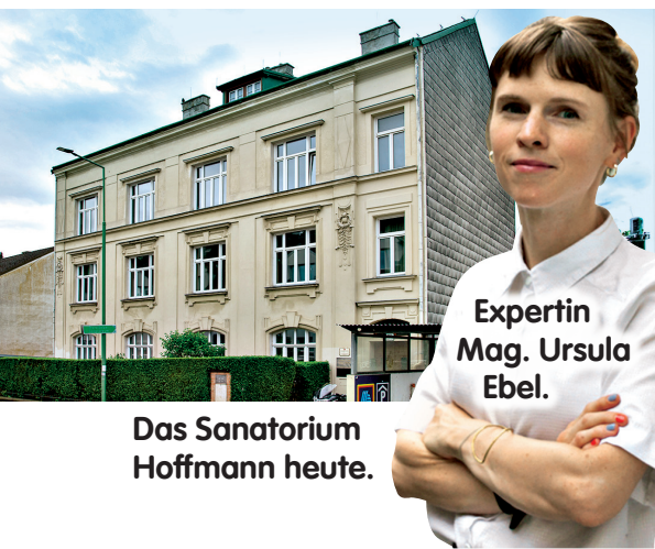
Das Sanatorium Hoffmann heute.