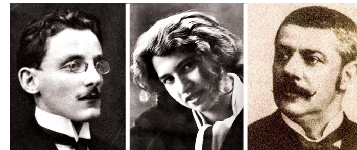
Kafkas bester Freund Max Brod (li.). Dora Diamant (Mi.) war die dritte Verlobte des Autors. Sein Vater (re.) kontrollierte jede seiner Beziehungen.