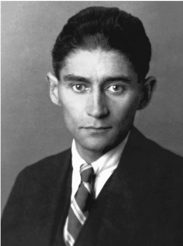
Das letzte bekannte Foto Franz Kafkas aus dem Herbst 1923, der Fotograf ist unbekannt.

Hajeks prominente Patienten: Kafka und Freud