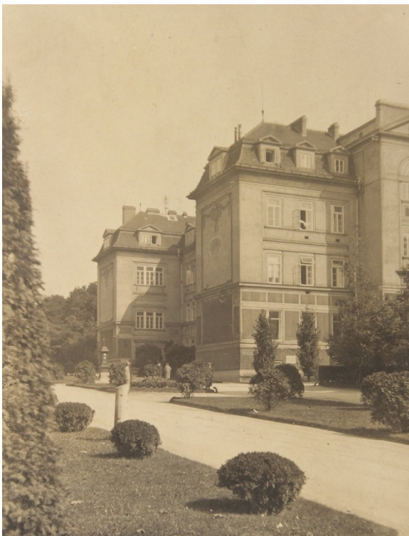
Allgemeines Krankenhaus, Klinik Prof. Hajek, um 1930

endonasalen Operationszugangs zur Hypophyse (Hirnanhangdrüse).