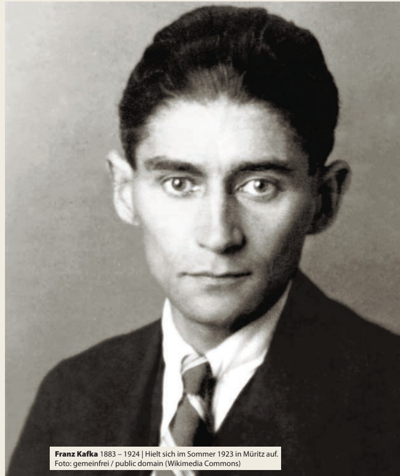
Franz Kafka 1883 – 1924 | Hielt sich im Sommer 1923 in Müritz auf.

Tourismus- und Kur GmbH Graal-Müritz, Rostocker Str. 3, 18181 Graal-Müritz