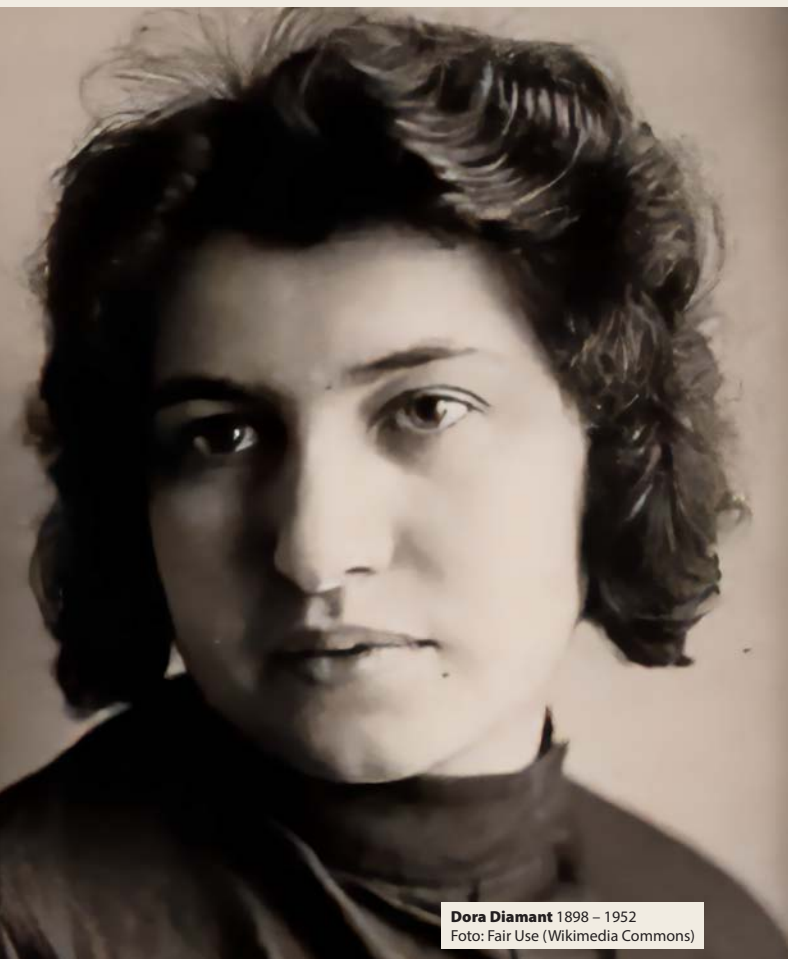
Dora Diamant 1898 – 1952