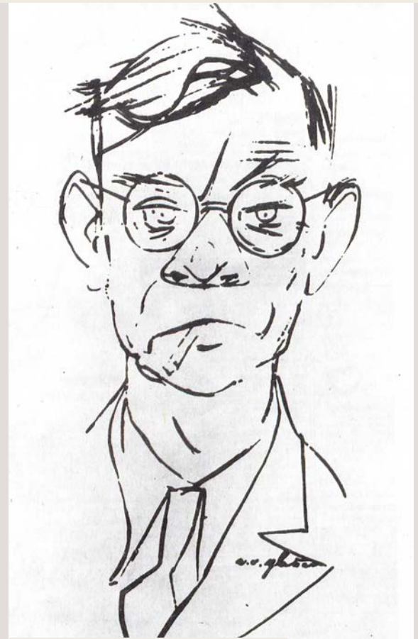
Hans Fallada 1893 – 1947 | Grafik: Erich Ohse