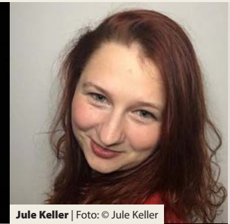
Jule Keller