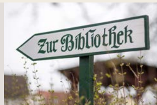
Bäderbibliothek, Fritz-Reuter-Straße 17, 18181 Graal-Müritz

Tipp: ab 15:00 Uhr Kaffee & Kuchen im Garten der Bibliothek (Nicht bei Regen!) .