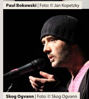
Skog Ogvann